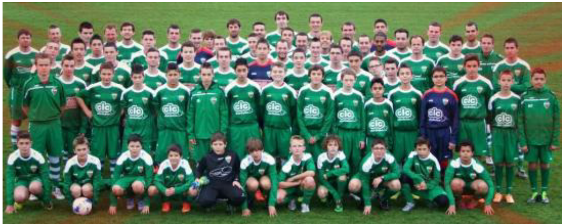
La photo officielle de l'ALC foot, version 2015